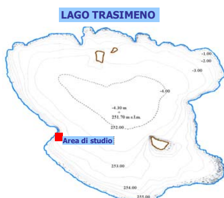
Fig. 1 – Batimetria del Lago Trasimeno e area di monitoraggio

I Chironomidi raccolti sono stati osservati allo stereomicroscopio, al fine di evidenziare le caratteristiche morfologiche e misurare alcune variabili biometriche (lunghezza torace-addome, lunghezza e ampiezza della capsula cefalica) per l'individuazione dell' instar di appartenenza. Successivamente, l'osservazione al microscopio ottico ha consentito l'esame delle capsule cefaliche per l'attribuzione specifica (Ferrarese 1983; Nocentini 1985).